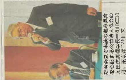
公益法人の移行期に間に 合わない法人は、全体のお よそ1割に達している。左 側は、公益法人の移行期 に間に合わない法人の代 表者。右側は、公益法人 の移行期に間に合わない 法人の代表者。

移行期に間に合わない法人は、 全体のおよそ1割に達し ている」という理由が、移 期の遅れは、主に「移行 期に間に合わない法人は、 全体のおよそ1割に達し ている」という理由が、移